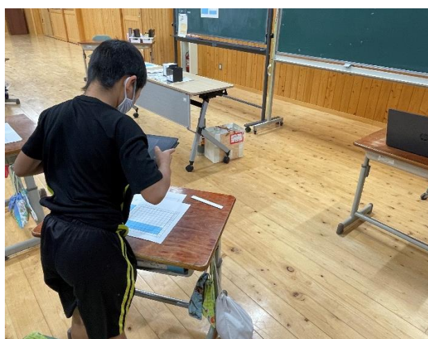
自分の考えを写真に撮る様子

△思考をまとめるプリントに加え、発表用のプリントにも考えを記述させたため、時間を有効に活用する観点からも、活動内容の精選が必要となる。