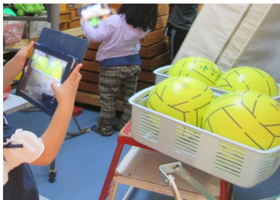
探険先で写真を撮っている場面