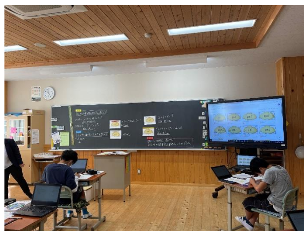
板書とも組み合わせて授業を展開することで、ノートにも記録が残る