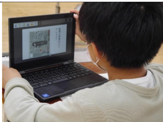
児童が新聞の特徴を見つける場面。

△児童ごとにスタンプの色分けをするなど視覚的に分かる工夫をすると誰の意見なのかが分かりやすい。児童の気づきを教師がまとめていくのではなく、友達の考えを見ながら自分の気づきと比較し、学びを深めていけるような授業展開を工夫する必要がある。