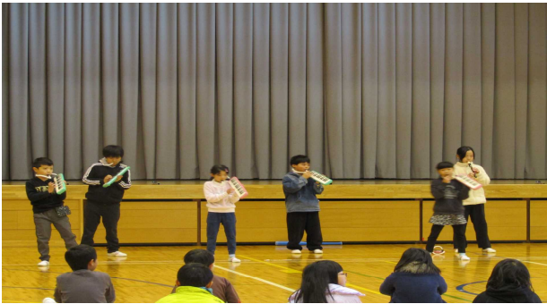
一人一人が周囲の音に合わせます