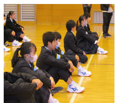
生徒会長のことば