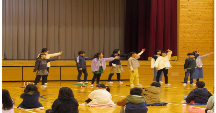
歌声に合わせて振りも伸びやかです