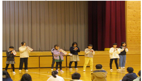
ぴったりそろったハーモニー