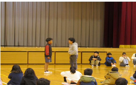
5・6年生は寸劇からスタートです