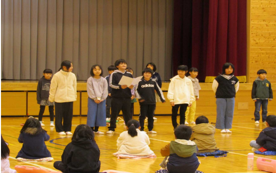
これまでの練習の過程やポイントが伝わります