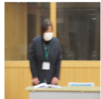
○2月9日に請願書提出