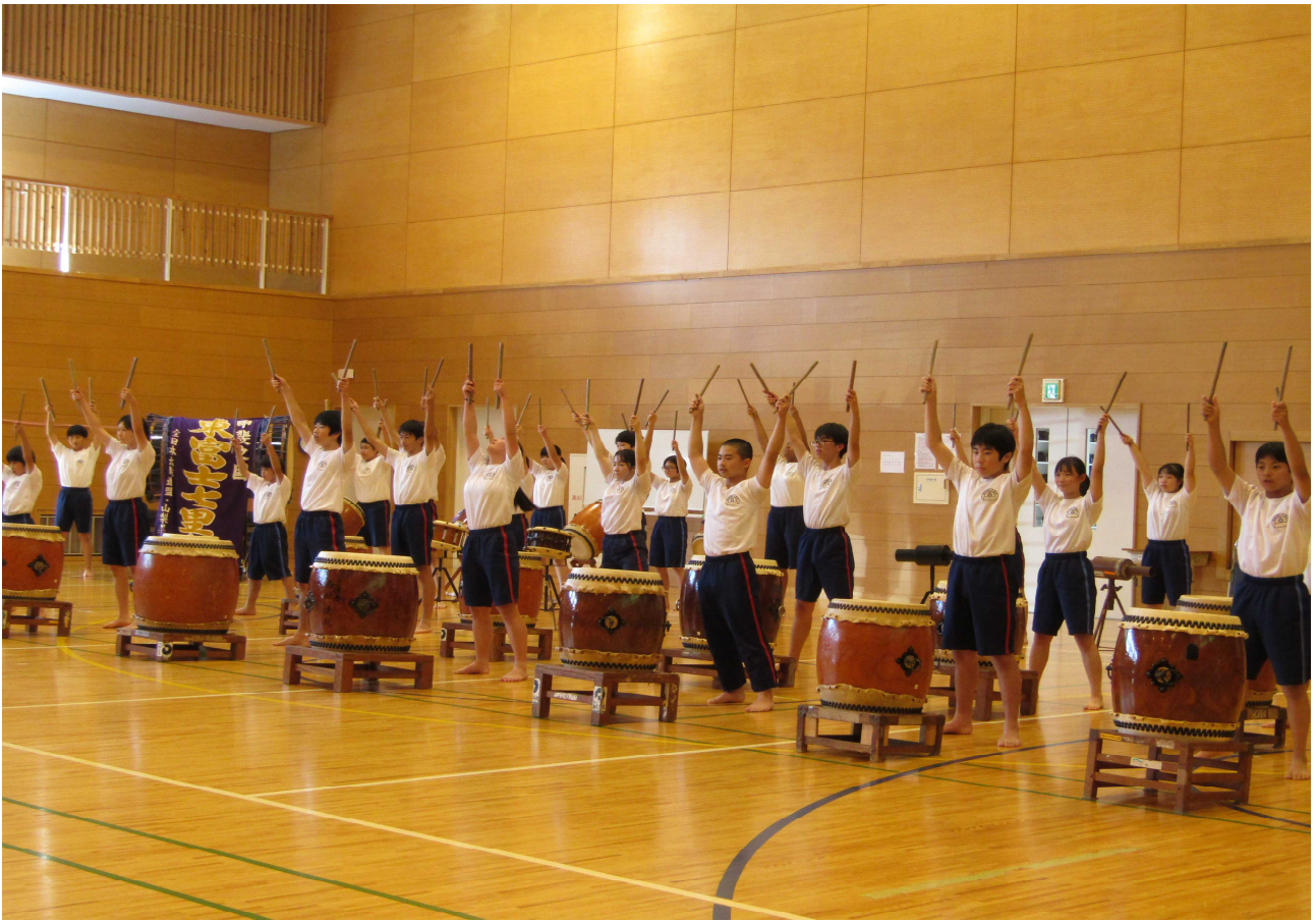
町村長会・南都留教育長会の皆様