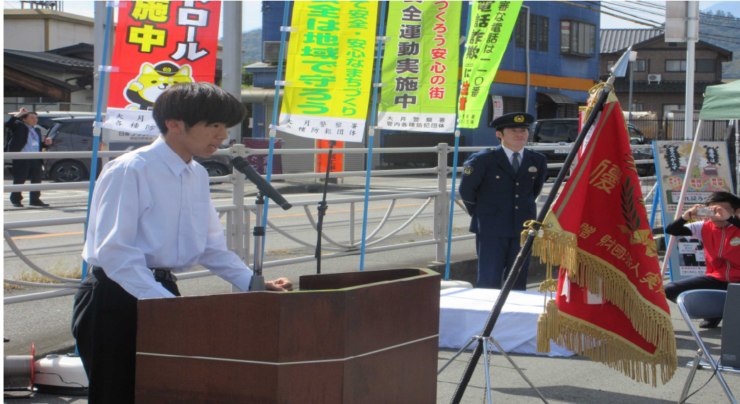
大月署からも表彰を受けました