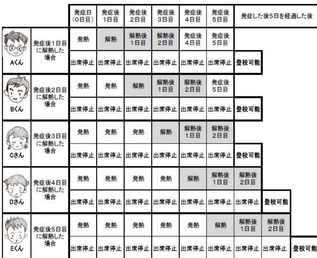
「インフルエンザ出席停止期間の基準」早見表

出席停止は、集団生活の場への出席を遠慮すべきマナーであると共に、何よりも優先したい本人の健康回復の観点から、病気の悪化や合併症予防のために療養が必要な期間となっています。出席停止の期間中は、早く元気になったとしても、外出は控え、療養に専念させてくださいますよう、よろしくお願いします。